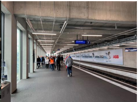
Weiterfahrt aufs Jungfraujoch