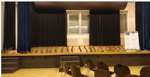
Vorbereitung Theorieabend Aula Schulhaus Bleichestrasse

Die Theorieabenden konnten wir leider nicht mehr in der Müli Deisswil durchführen, jedoch fanden wir mit der Aula im Schulhaus Bleichestrasse einen guten Ersatz