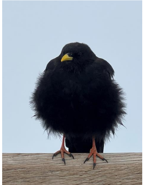
Es war sehr kalt und windig auf der Aussichtsterrasse