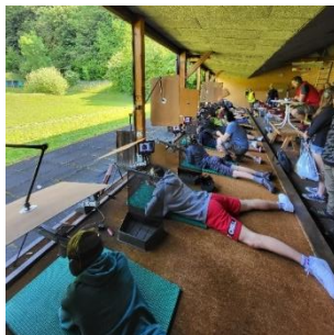
Links das Pistolenschiessen und rechts das Feldschiessen